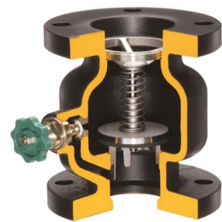
スモレンスキ型逆止弁 カットモデル