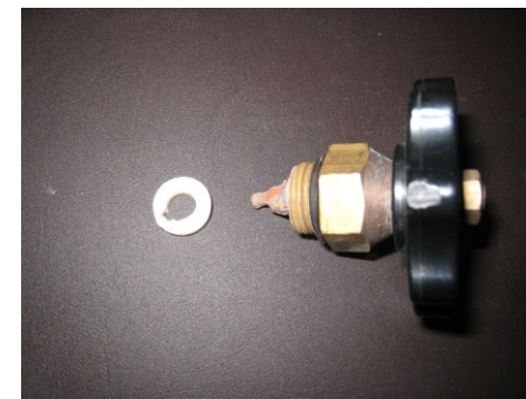
弁棒が消失したバイパス弁とテフロンパッキン

解説：ナイロンライニングの皮膜は非常に強力で、耐食性に優れておりますが、塗膜も厚く弾力があります。バイパス弁に使用しているテフロンパッキンは耐食性や温度にも強い優れた素材ですが、やはり弾力があります。今回のケースではバイパス弁を閉めたつもりが、閉め方が弱くナイロンライニングとテフロンパッキンの応力緩和（跳ね返り）により微小な隙間ができていたと思われます。そのために、ちょうどホースの先を絞ったように、水が勢いよく噴出し侵食が進んだと思われます。また、脱亜鉛腐食の痕跡も見られますが、脱亜鉛腐食を起こした部分は侵食を受けやすく、より侵食が進む原因になったと考えられます。