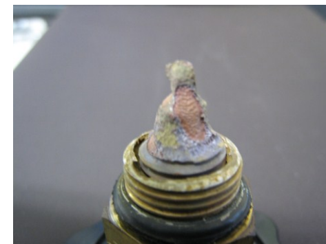
弁棒が消失した部分の拡大写真